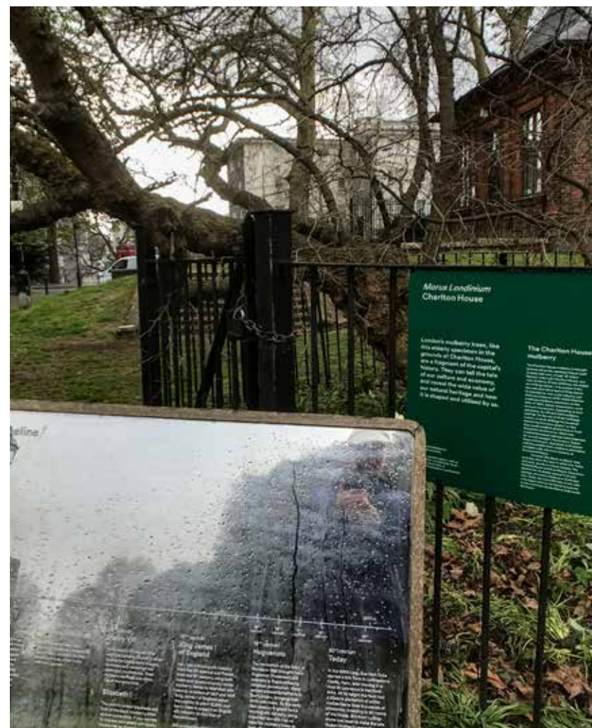
Signage by the 400 year-old mulberry at Charlton House.

The project was launched with a 2-year Heritage Lottery Fund grant to the Conservation Foundation, followed by smaller awards from The Worshipful Company of Weavers and The Tree Register of the British Isles (TROBI). It was a winner of a 2021 European Heritage / Europa Nostra Award.