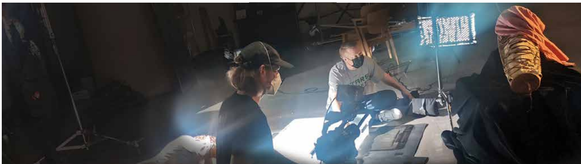
Preparing the move of the Sámi collection to The Sámi Museum and Nature Centre Siida.