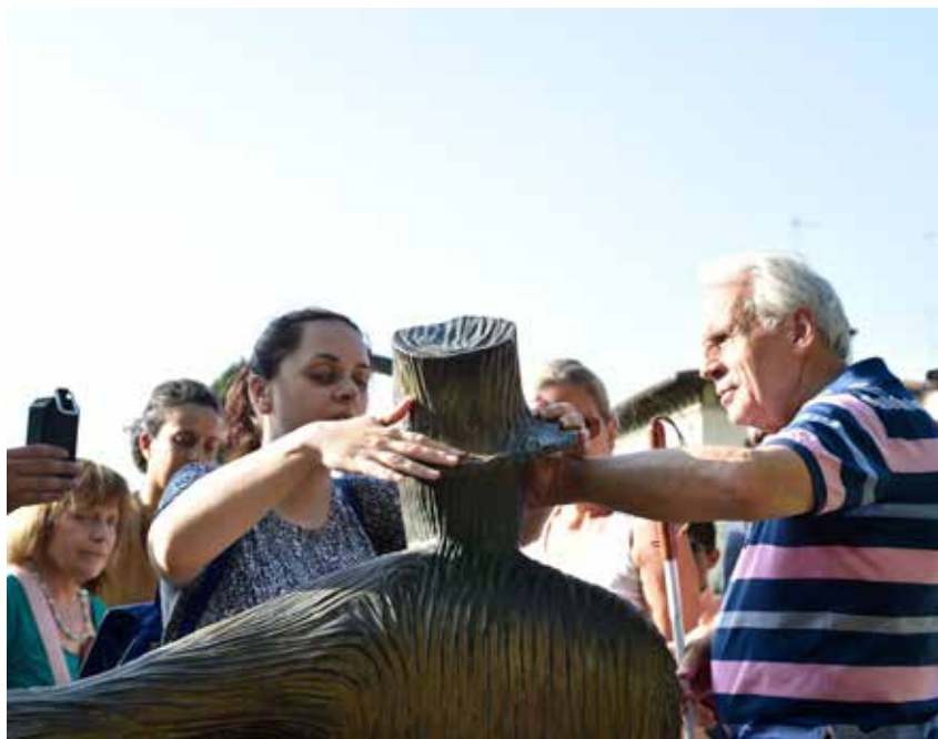
Giardino delle rose a Firenze, podcast tattile e vidimazione.