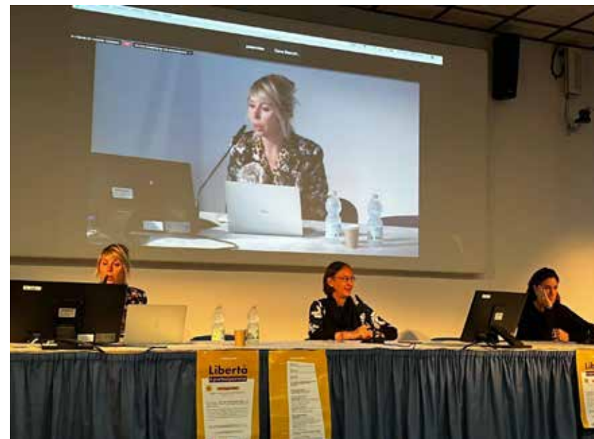
Workshop Libertà è partecipazione , Museo di Storia Naturale del Mediterraneo - Provincia di Livorno.

Al workshop abbiamo ascoltato i racconti di tante esperienze diverse, nate per finalità diverse, ma con un unico denominatore comune: sono una fusione perfetta di progettualità e di cuore.