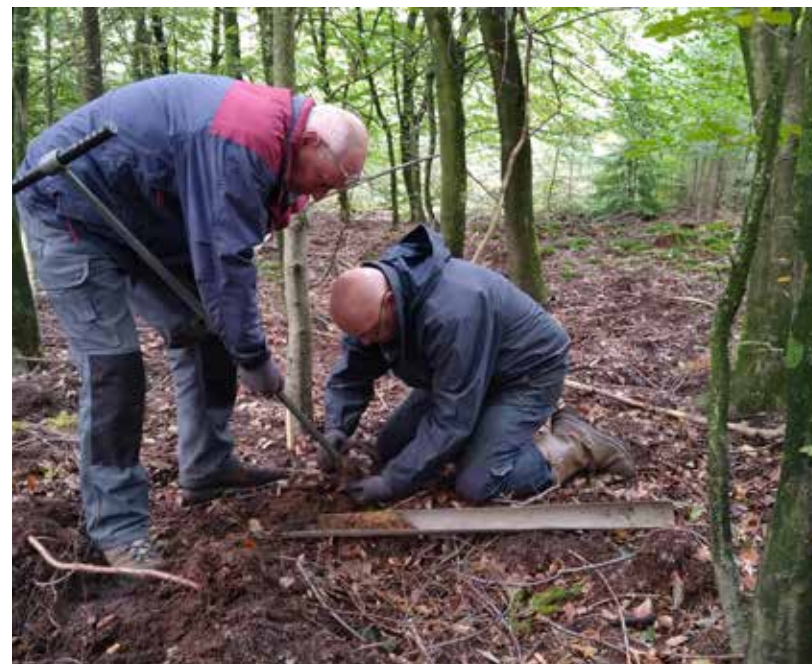
Volunteers taking soil samples in the Speulderbos wood.

The Heritage Quest project started in the Veluwe as a collaboration between Gelderland Heritage and Leiden University and was later carried out on the Utrechtse Heuvelrug in collaboration with Landscape Heritage Utrecht. The project received funding from the Province of Gelderland, the Province of Utrecht, the Cultural Participation Fund, the North Veluwe Culture and Heritage Pact, the Utrechtse Heuvelrug National Park, the Municipality of Arnhem and K.F. Hein Fund.