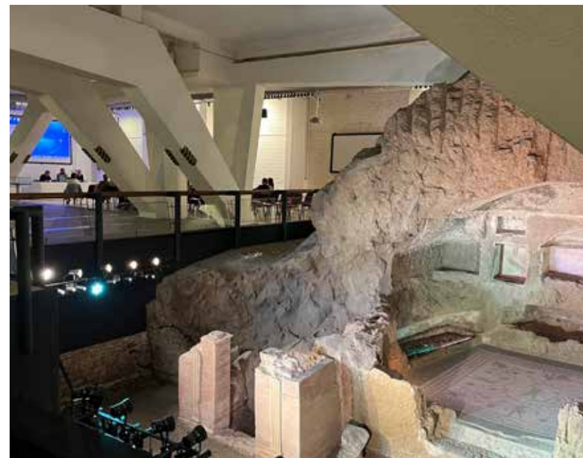
Drugstore Museum, tomba A e spazio conferenze.