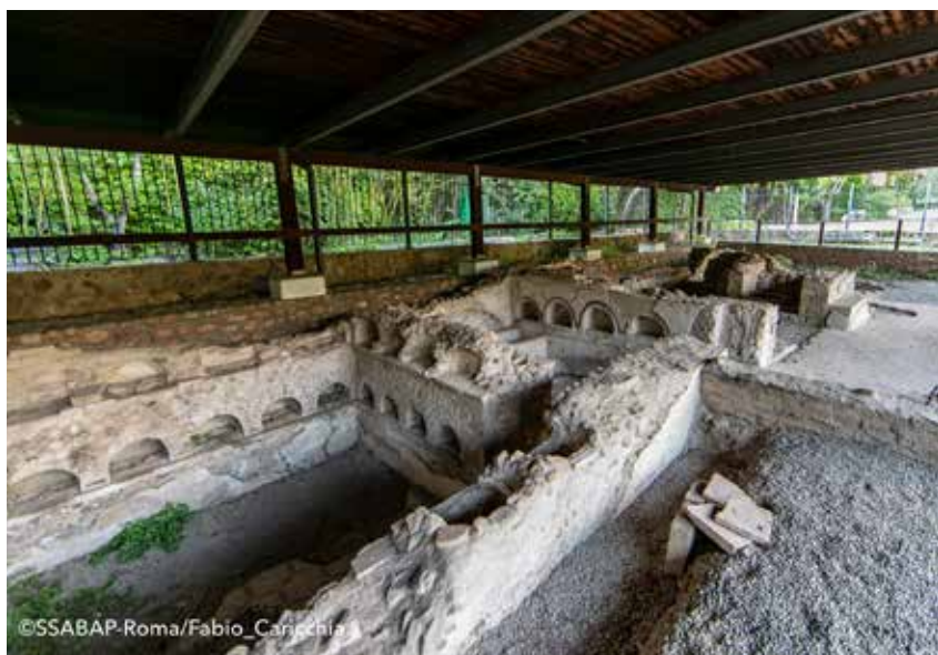
Necropoli di Vigna Pia, veduta panoramica.