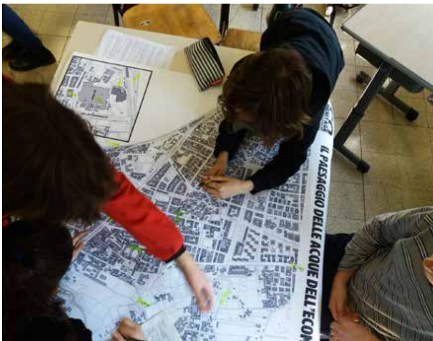
Workshop di mappatura delle risorse presso I.C. Simonetta Salacone, Roma 2019.