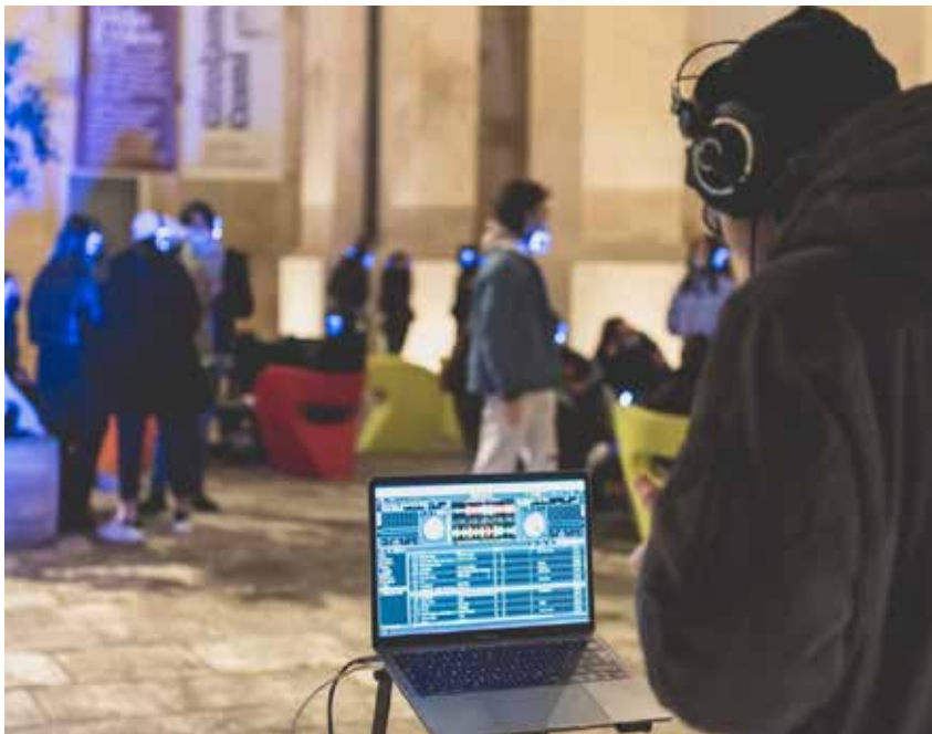
Swapper Fest - december 2021.