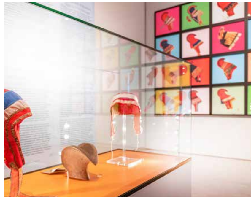
Ladjogahpir, Hornhat and artwork Máttaráhku ládjogahpir – Foremother´s Hat of Pride from Outi Pieski in Mäccmõš, maccâm, máhccan – The Homecoming exhibition.