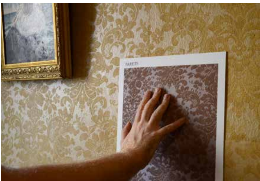
Casa Museo Carducci a Castagneto Carducci, tavola tattile.