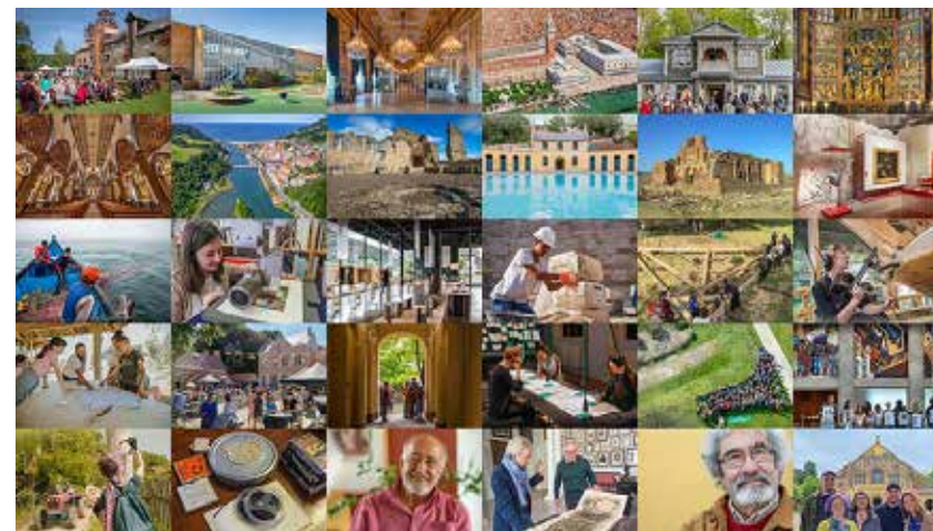
I vincitori degli European Heritage Awards / Europa Nostra Awards 2023.

Since 1 st May 2023, Europa Nostra has led the European consortium selected by the European Commission to run the European Heritage Hub pilot project. Europa Nostra is also an official partner of the New European Bauhaus initiative developed by the European Commission, and is the Regional Co-Chair for Europe of the Climate Heritage Network .