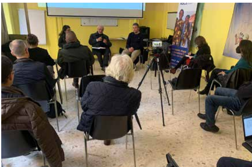
Giornate del Territorio, conferenza presso Casa Scalabrini, Roma 2022.