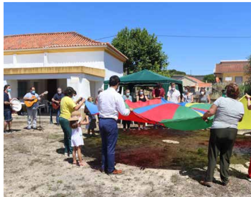
The Louriceira de Cima community in the Municipality of Arruda dos Vinhos welcomes the arrival of artworks from the Museu de Aguarela Roque Gameiro, located in Minde, to their village.