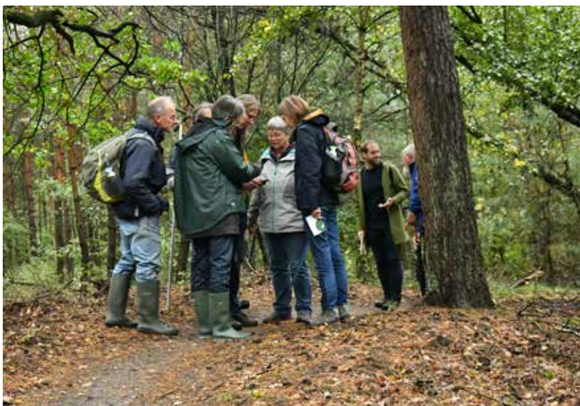
Volunteers in Ermelo forest.