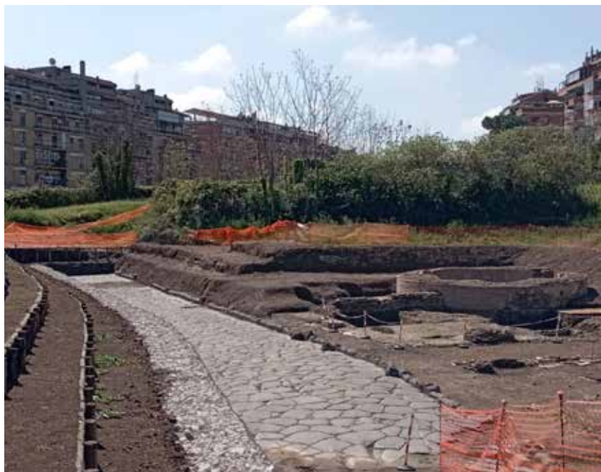
Area archeologica Pozzo Pantaleo, veduta panoramica.