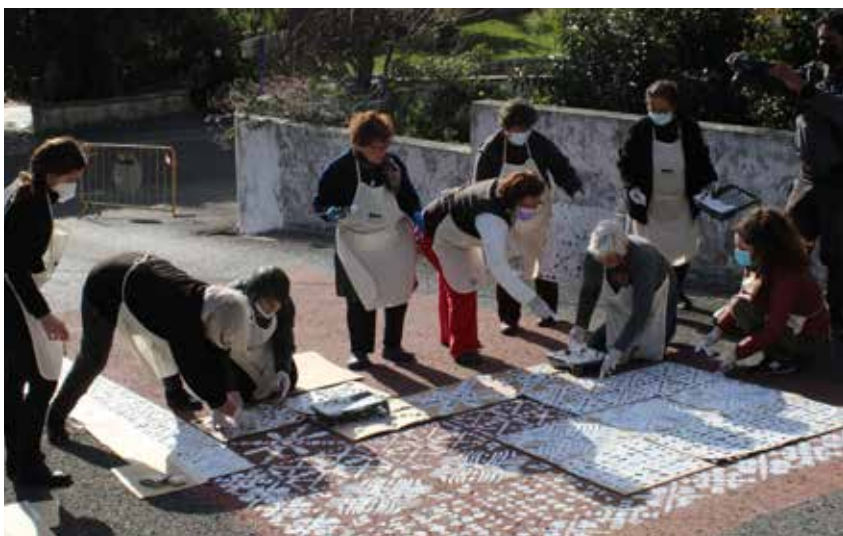
The Folgarosa community in the process of painting an urban art tapestry on one of the village streets.