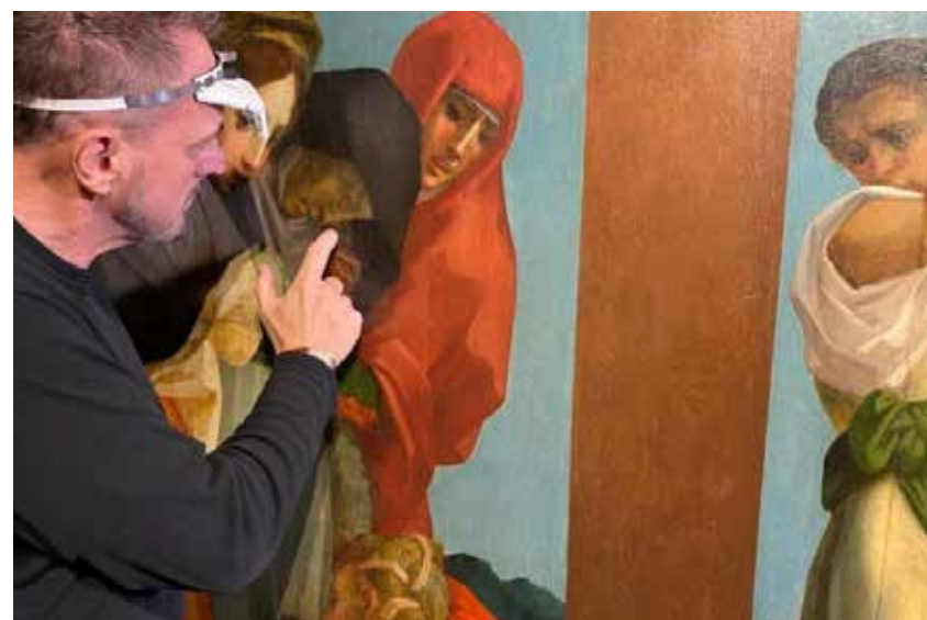
Pinacoteca di Volterra, restauro della Deposizione di Rosso Fiorentino aperto alla comunità.