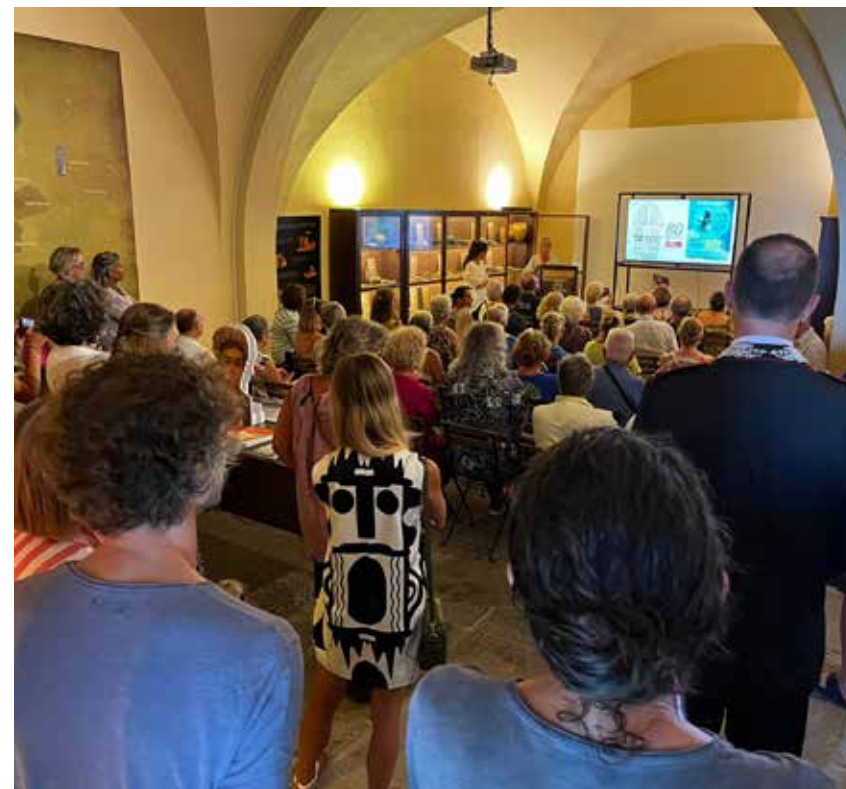
Museo etrusco di Populonia, inaugurazione della mostra Arpia o Sirena? (photo: Erica Foggi).

Per il primo anno di attività, data la recentissima costituzione del Sistema, è stata condivisa la necessità di sviluppare percorsi di conoscenza reciproca tra i musei e i parchi aderenti: persone, azioni e progetti. Oltre a questo, si è voluto organizzare, in collaborazione con il Centro studi per l'archeologia pubblica "Archeostorie" , un workshop di scambio internazionale per conoscere e confrontarsi con esperienze e buone pratiche italiane e europee, condotte da direttori, operatori museali e ricercatori impegnati nella condivisione e nella partecipazione delle comunità alle attività del museo, attraverso programmi di citizen science , cura del patrimonio, trasmissione della tradizione, innovazione sociale e sperimentazione culturale che, attraverso linguaggi nuovi, stimolano le comunità locali e rafforzano l'identità e l'attrattività dei luoghi.