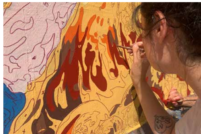
Street artist presso il Museo di Arte Urbana delle Migrazioni, Roma 2021.