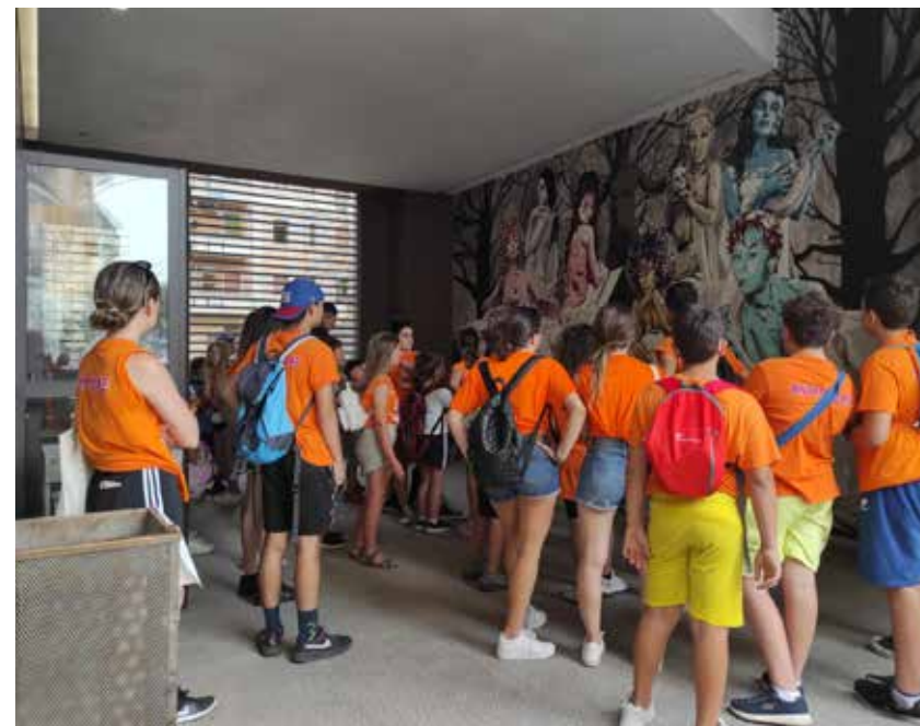
Visite guidate per studenti lungo il percorso della street art, Roma 2019.