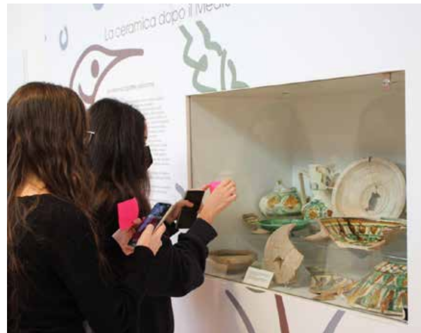
Fanzine with the output of the project.

In accordance with the new definition of a museum, approved by the ICOM Plenary Assembly at its last session in August 2022 , the museum is invited to register the impact of its activities on the territory in which it operates, an impact that does not end with the experience of enjoying the collection, but rather it starts from the objects but is capable to achieve broader personal and collective reflections. This is a mission statement that Swapmuseum aims to accomplish through its future activities, starting from its consolidated methodology and innovating progressively the process according to specific needs and new challenges.