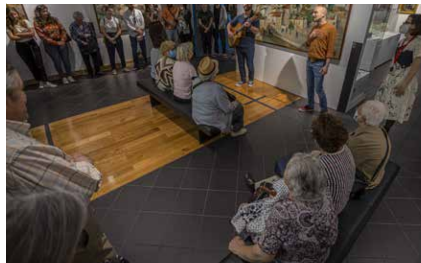
The Museu de Leiria, located in the municipality of Leiria, opens its doors to welcome the Columbeira community from the Municipality of Bombarral with a performance by SAMP artists.