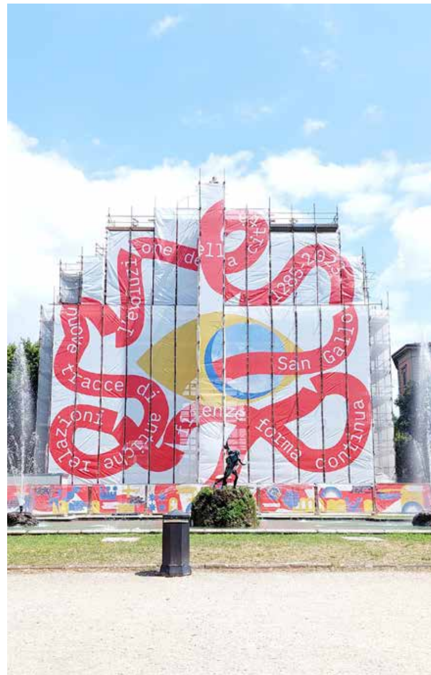
Progetto Firenze Forma Continua , installazione in Piazza della Libertà.