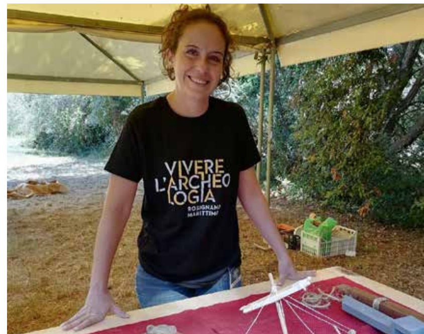
Festival Vivere l'Archeologia a Vada Volaterrana , organizzato dal Museo Civico Archeologico Palazzo Bombardieri di Rosignano Marittimo e l'Università di Pisa.