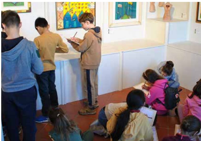
Percorso didattico al Museo "Giuliano Ghelli", San Casciano Val di Pesa.