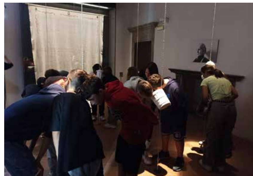
Attività con i ragazzi al Piccolo Museo del Diario di Pieve Santo Stefano, Fondazione Archivio Diaristico Nazionale.