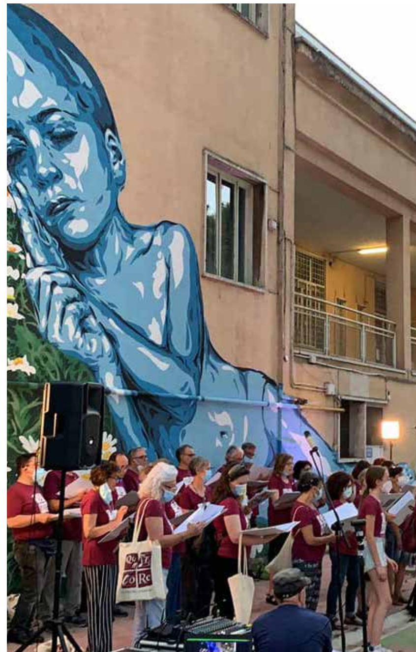
Coro amatoriale Quadracoro, esibizione presso I.C. Artemisia Gentileschi, Roma 2021.

Paesaggistico e Naturalistico: all'interno del territorio dell'Ecomuseo Casilino Ad duas lauros , oltre ai parchi storici e alle aree protette, abbiamo numerosi appezzamenti di terreno più o meno estesi, dove cresce una vegetazione spontanea ma non per questo meno interessante rispetto a quella delle aree citate sopra. Spesso questi spazi non ancora urbanizzati diventano dei piccoli ma preziosi habitat , dove prosperano o vivono numerose specie floristiche o faunistiche. Spesso sono proprio questi gli spazi che finiscono per essere sacrificati al cemento, alla costruzione di case e palazzi, capannoni, attività commerciali o strade. Gran parte delle risorse presenti sono state individuate e censite dal WWF Pigneto-Prenestino .