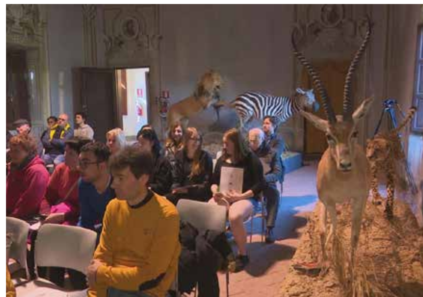
"PercorsinEvoluzione" ai Musei di Villa Baciocchi, Capannoli.