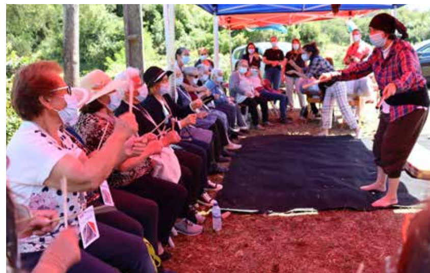
Performance of SAMP team artists with the São Bento community to celebrate the arrival of museum objects from the Rede Museológica do Concelho de Peniche.