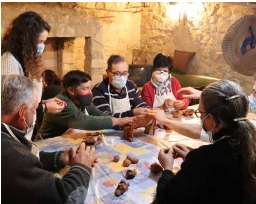
The Ateanha community in the Municipality of Ansião, engaging in the creative process to plan their collective artwork.