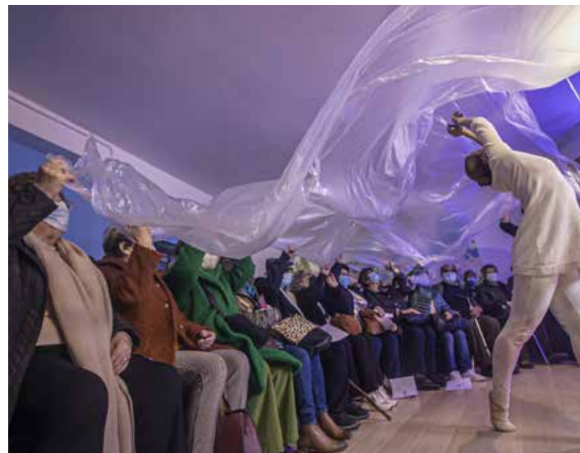
The Alcanadas community from the municipality of Batalha celebrates the inauguration of their collective artwork with the elderly from Club Idade+ at the Mudeu da Lourinhã in the municipality of Lourinhã.

Youtube: https://www.youtube.com/@SAMP-Pousos