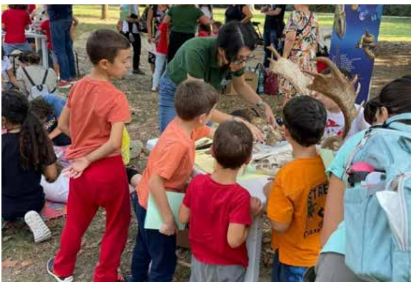
Scienza al parco , laboratori per bambini organizzati dal Museo di Storia Naturale del Mediterraneo - Provincia di Livorno (photo: Musmed).