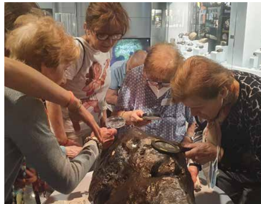
Attività con la comunità al Museo di Scienze Planetarie di Prato, Fondazione ParSeC.

Perché un territorio culturalmente attivo è un territorio ricco, qualunque sia il "metro" con cui tale ricchezza la si voglia misurare.