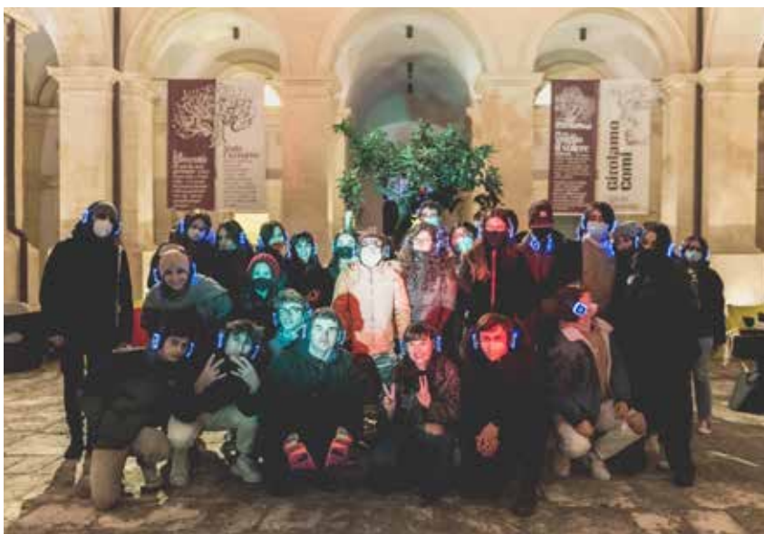
Volunteers and Swapmuseum tutors during the Swapper Fest - december 2021.