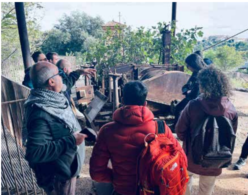
Esperienza al Parco Tecnologico Archeologico delle Colline Metallifere di Grosseto.