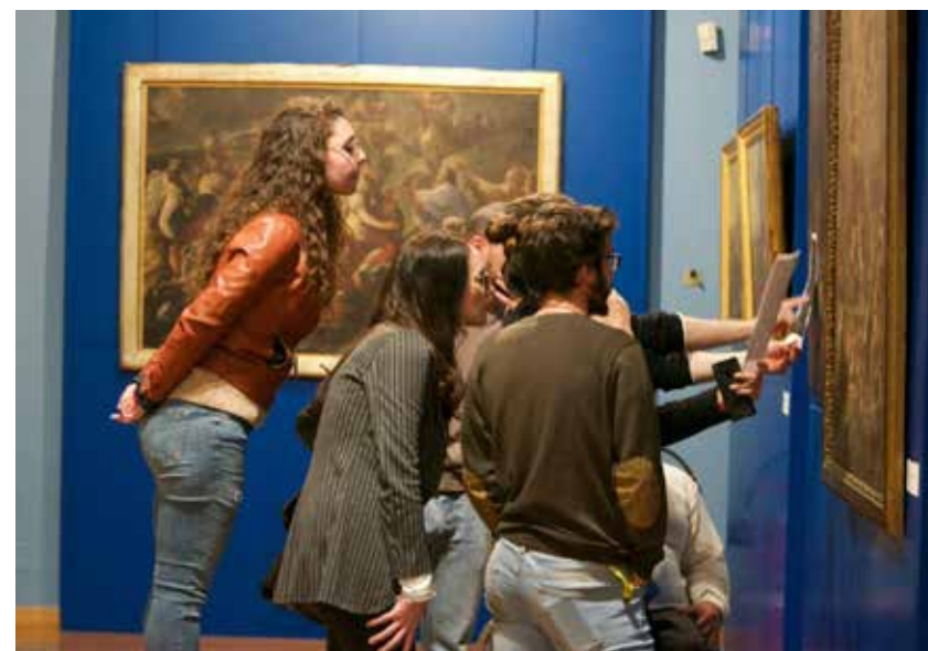
Volunteers during a Swapmuseum's call to action in the Ceramics Museum in Cutrofiano (photo: Elena Carluccio).