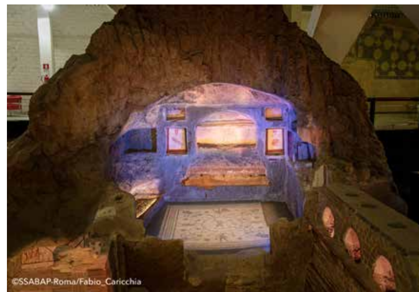
Drugstore Museum, tomba A.