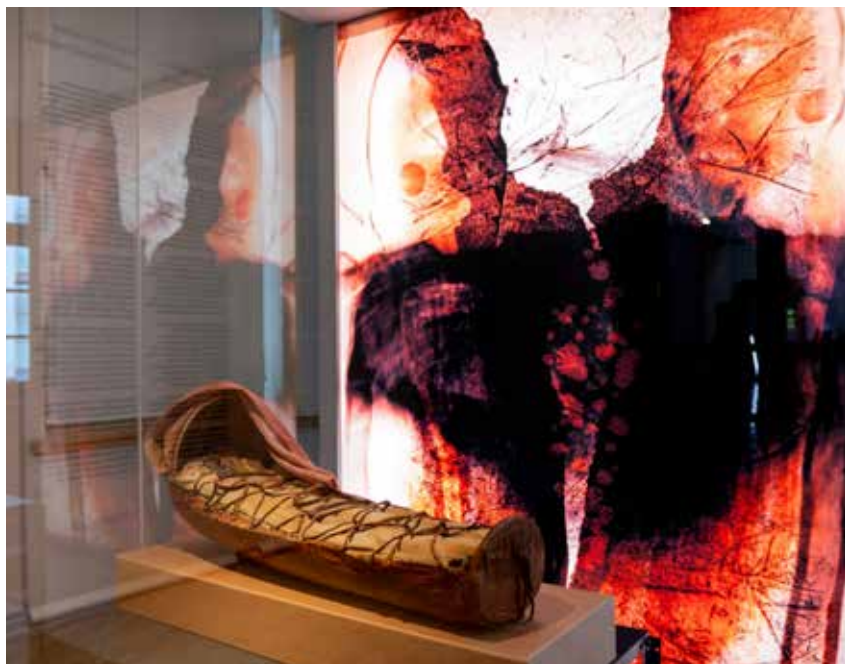
Gietkka, Saami cradle and artwork from Lada Suomenrinne in Mäccmõš, maccâm, máhccan – The Homecoming exhibition.