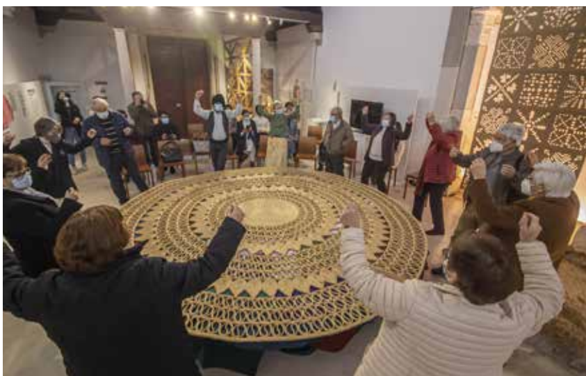
The Folgarosa community came together to celebrate and unveil their collective artwork at the Museu de Arte Popular Portuguesa in the Municipality of Pombal.