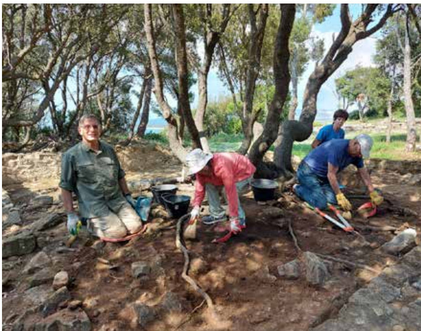
PArCo di Poggio del Molino, volontari impegnati nella pulizia del sito.