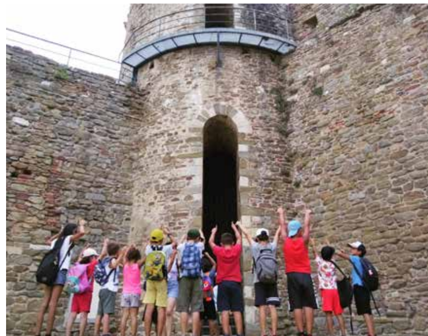
Laborario didattica alla Rocca Pisana, Musei di Scarlino.